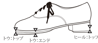
トゥ:外側 ※タップ終点位置からのビルドアップ長さ。